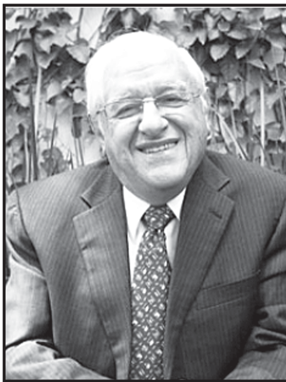
Ser egresado de la UAC, era la propuesta catonista para eliminar a Melchor de la futura contienda por la Rectoría.

Finalmente se descartó el requisito de ser egresado de la UAC. La propuesta catonista era para eliminar a Melchor de la futura contienda por