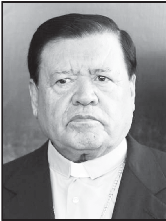
Norberto Rivera Carrera. Protector de curas pederastas, arzobispo de los ricos y destructor de la Teología de la Liberación en México.