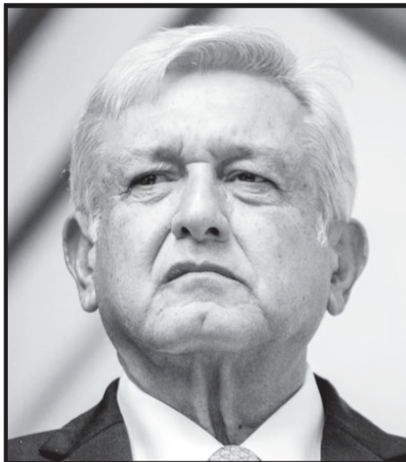
AMLO debe cuidarse de tener a los enemigos cerca pero no dentro de su casa.

Hay una enorme cantidad de “depredadores” en la política y la economía nacional que nos podríamos espantar, pero resulta muy extraño que un país lleno de pobres y marginados, tengamos a 16 mexicanos que tienen una cantidad superior de dinero a lo que es la Deuda eterna de México y que tenemos que pagarla nosotros, no ellos, porque en este país curiosamente, se salva a los bancos y banqueros pero no a los jodidos de la tierra. Nos espantamos porque atacan la villa del cardenal o