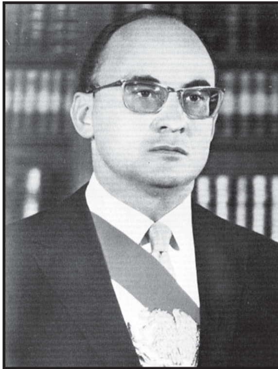
Luis Echeverría Álvarez. Entró en conflicto con los empresarios, provocó al gobierno norteamericano, ofendió al ejército y México entró en una espiral de confrontación.

Con José López Portillo la tormenta prosiguió, hubo más desorden financiero y desconfianza empresarial en las acciones presidenciales. López registró su defensa perruna de la moneda mexicana y culpó a los “traidores empresarios saca dólares” y a “los banqueros que apostaron contra el peso”.