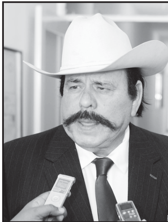
Armando Guadiana Tijerina. El político coahuilense con mayor cercanía con el presidente electo Andrés Manuel López Obrador

Todo hace suponer que Morena tiene una alfombra lista de proyectos para consolidar a su organización política en los próximos años en todo el territorio mexicano y en sus 32 entidades