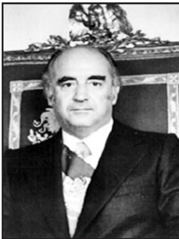
José López Portillo. Hubo más desorden financiero y desconfianza empresarial. En su último Informe expropió los bancos.

La leyenda negra se armó, los empresarios y sus medios se dedicaron a atacar despiadadamente a los expresidentes que habían fracasado en sus proyectos nacionalistas, de enfoque social y desafiando a la élite económica y hasta a los norteamericanos. A Echeverría y López Portillo los hundieron sus propios errores, midieron mal sus fuerzas, su poderío no daba para tanto. Además, sus gobiernos fueron un desastre económico que abrió las puertas al Banco Mundial, al Fondo Mone-