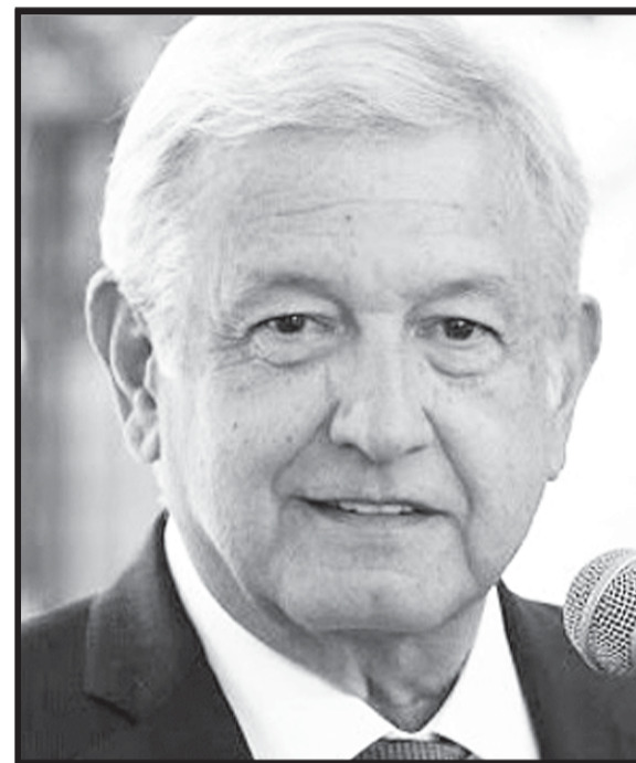
Andrés Manuel López Obrador, presentará una iniciativa de ley de responsabilidad ciudadana que desaparecerá la figura de inspectores del gobierno federal.

Con la puesta en marcha de la citada ley se abraza la esperanza de que los inspectores, esa fauna tan nociva para la sociedad, es prescindible.