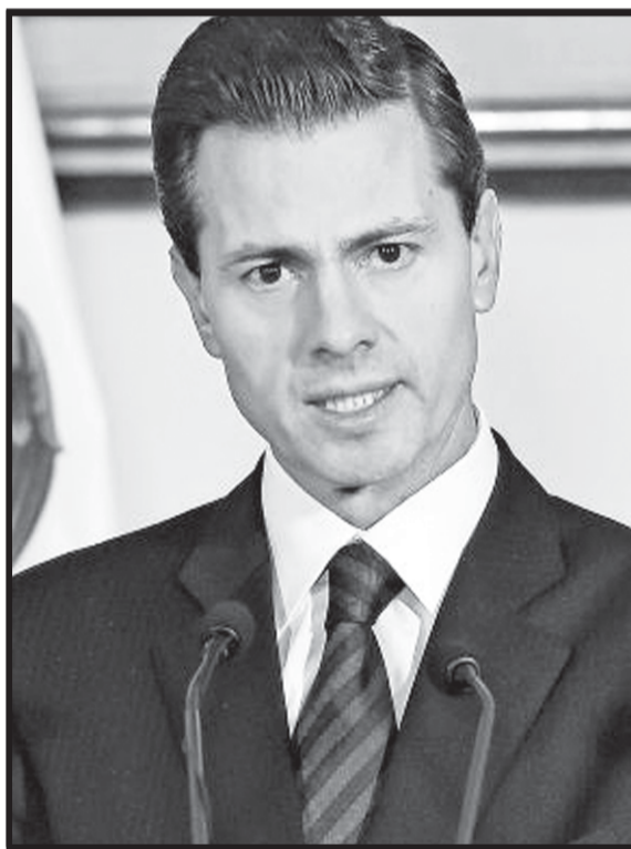
Enrique Peña Nieto es el primer mandatario en buscar el amparo de la justicia federal, antes de terminar su sexenio.